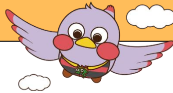
埼玉県のマスコット 「さいたまっち」