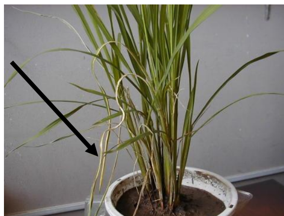
図2 イネ縞葉枯病発病株 (矢印：こより状の黄色く枯れた葉)