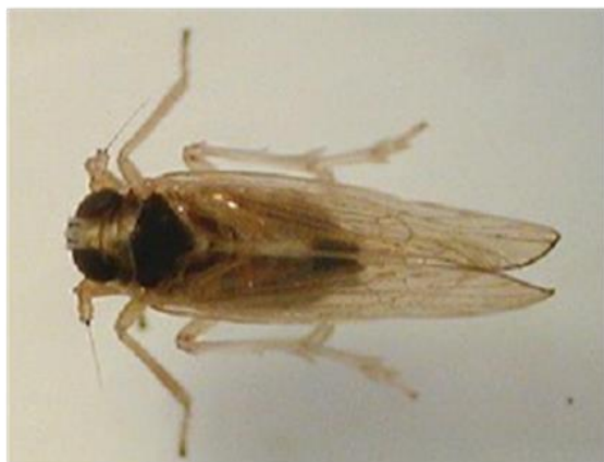
図1 ヒメトビウンカ雄成虫 (体長約3.5mm)